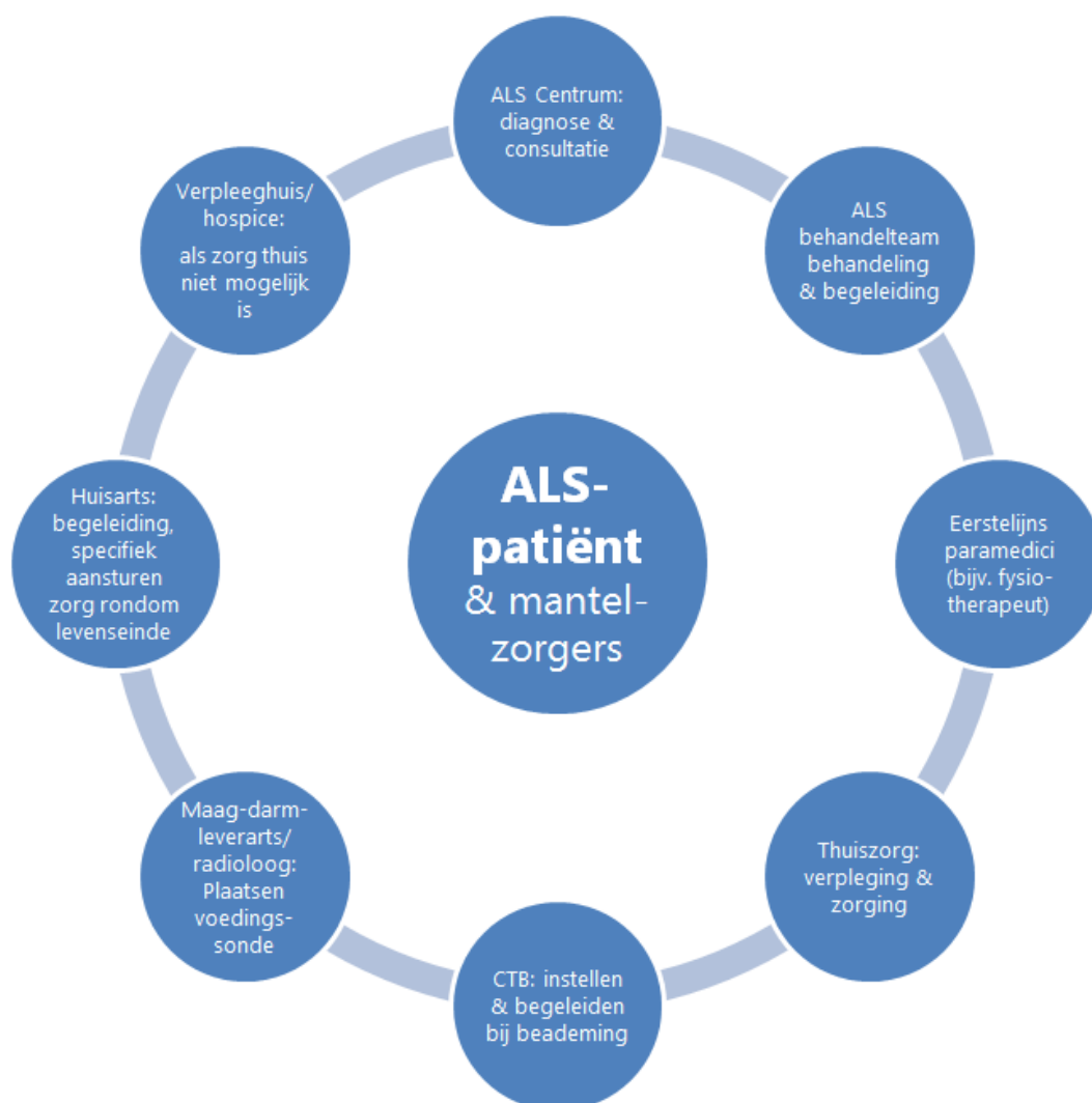
Figuur 1 De zorgverleners rondom de ALS-patiënt & mantelzorgers)